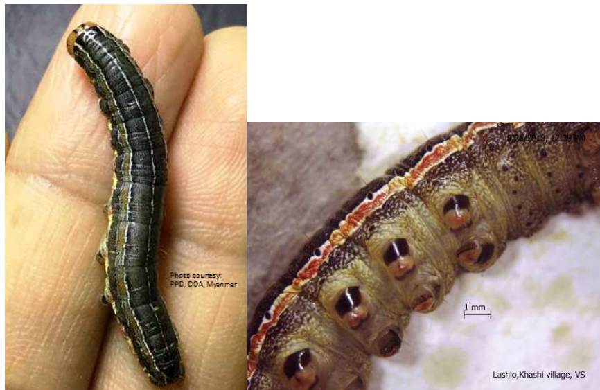
Photos: PPD, DOA, MOALI Myanmar (Identification Ref: 1. Passoa, S.C.2014, 2. www.daf.qld.gov.au)