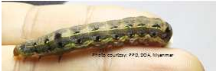
(Identification Ref: 1. Passoa,S.C. 2014, 2. OEPP/EPPO.Bulletin,2015)

၃) အင်္ဂလိပ်အမည် :Black Armyworm/African Armyworm မြန်မာအမည် :ငမြောင်တောင် သိပ္ပံအမည် : Spodoptera exempta စားသောက်ပုံ :ကိုက်ဖြတ်ခြစ်စားသည်။